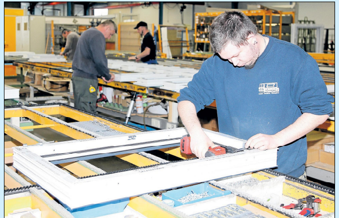
„Wir bauen für Sie das passende Fenster“, verspricht die Firma Schock

beim Schock Fensterwerk die Produktionsabfälle der Wiederverwertung zugeführt. Die Abschnitte von den PVC-Profilen werden gesammelt, in Recyclingbetrieben sortiert und anschließend zerkleinert. Aus dem so gewonnenen sortenreinen PVC-Recyclat-Granulat entstehen wieder Profile und andere langlebige Produkte für den Fensterbau. Auch am Ende der Nutzungsdauer von Fenstern, Rollläden und Türen aus Kunststoff kann man die Rohstoffe zurückgewinnen und erneut in die Kunststoffprofilproduktion einbringen. „Zwischenzeitlich ersetzen wir schon alte Schock-Fenster (und auch Fremdprodukte), die wir vor 25 bis 30 Jahren eingebaut haben, aber nicht weil sie kaputt sind, sondern weil sie nicht mehr den wärmetechnischen Anforderungen genügen“, erklärt Eckhard Schock. arg