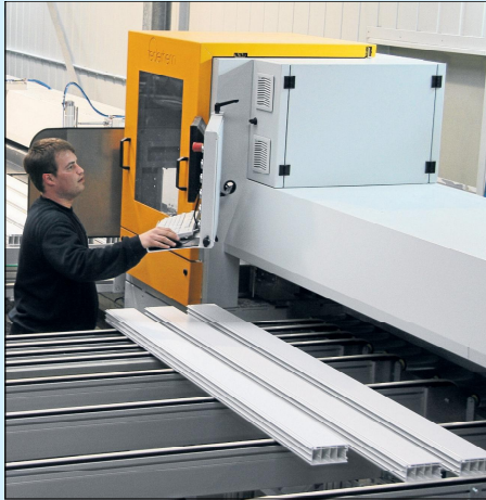
Computergesteuerte Fertigungsmaschinen sichern einen rationalen Produktionsablauf.

Von der Beratung bis zum Einbau: Qualität und Kontinuität bei den Produkten sind stets eine Selbstverständlichkeit